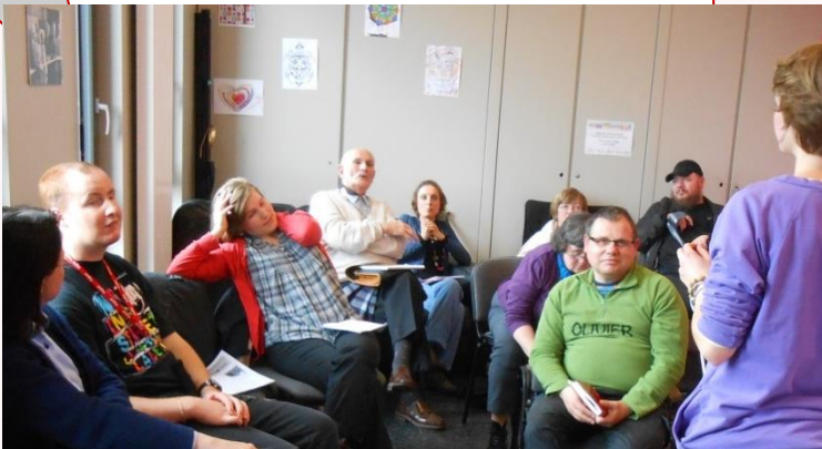
La première réunion du Comité au GEM LOGIS

La prochaine réunion est prévue Le jeudi 5 septembre à 14h au GEM Le Cap à Vanves