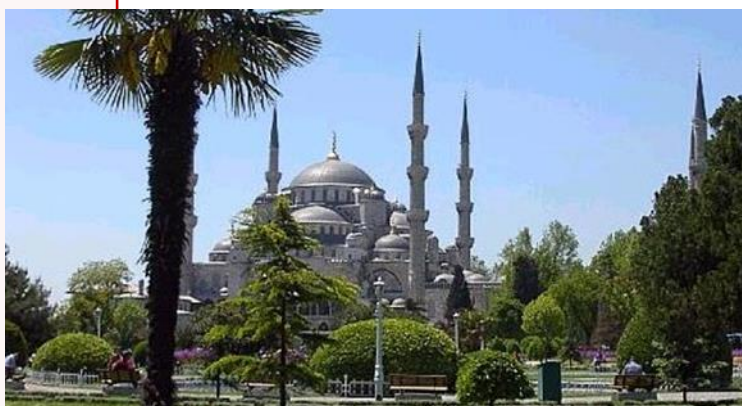
La Mosquée bleue d'Istanbul