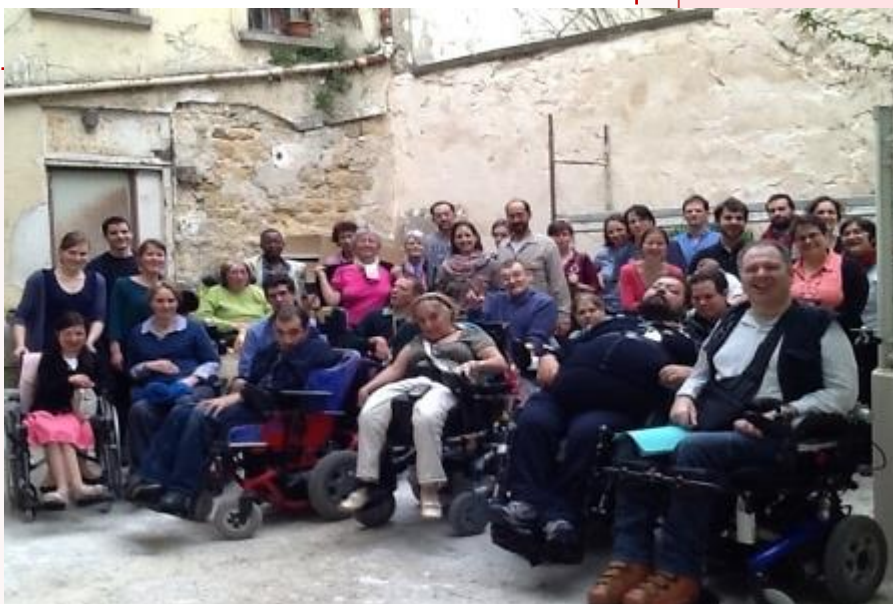
Notre première Assemblée Générale le 17 avril 2013