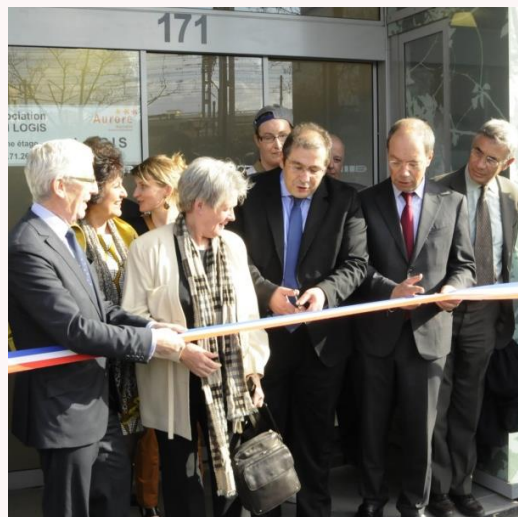
Inauguration de LOGIS, le 18 avril 2013